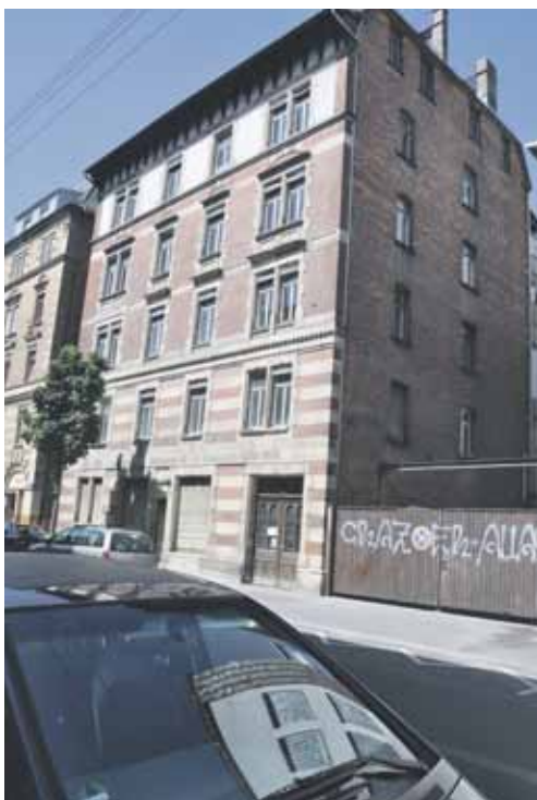
Ein lange Zeit schon leer stehendes Gebäude